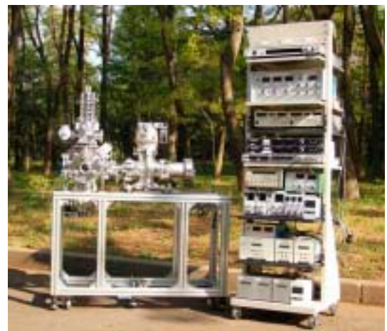
図 陽子移動反応-飛行時間型質量分析装置の全体写真

私たちが住む地球上には多種・多様な有機化合物が存在し、その起源も植物など生物が作り出すものや人工的に作られるものなど、様々です。大気中に揮発する有機化合物(揮発性有機化合物、以下VOC)は大気汚染の原因物質の一つであり、大気環境の悪化に伴う健康被害や食糧生産の低下といったリスクを減らすためにも、多成分のVOCを監視することの重要性が認識されてきています。その他、陸上・海洋の植物・微生物、細菌の生理・生態把握や、呼気の成分分析といった医療・健康分野、また食料品の衛生管理・品質管理の部門でも、VOCの監視が近年注目されています。例えば、草を伐採すると特定のVOC(アルデヒド)を放出する、などのように、VOCは、マクロからミクロのスケールでの環境の変化のシグナルを私たち人間に与えていると考えられます。そこで我々は、低濃度の揮発性有機化合物の多成分を同時に測定することができる陽子移動反応-飛行時間型質量分析装置(写真)を開発に取り組んでいます。本装置は一般に検出が困難な含酸素有機化合物(アルコール・アルデヒド、ケトンなど)を検出できる長所を持っています。現在、1分間の積算時間で0.1~1ppbv(1ppbvは体積混合比10億分の1)の揮発性有機化合物の数十種類を同時に検出することができます。