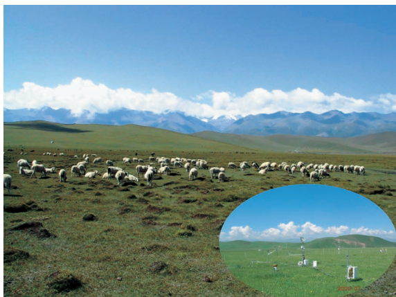
写真 放牧中の高山草原(中国青海省)

チベット高原は、「世界の屋根」ともいわれ、その平均標高は4000mを超えています(写真)。約370万km 2 以上の高原の大部分は、高い標高にもかかわらず、豊かな草原が広がっています。また、同緯度のほかの草原に比べ、チベット高原の夏は光が強く、比較的湿潤で、昼夜の気温差が大きいのが特徴です。このような環境は草原の炭素蓄積に有利であると考えられています。私たちは数年前からチベット高原でCO 2 の吸収量の観測を始めました(写真)。これまでの研究を通じて、この草原の炭素変動が次第に解明されつつあります。たとえば、チベット高原北部の草原では年間のCO 2 の吸収量が放出量に比べ高く、2002年からの三年間の平均値として、年に121g/m 2 のCO 2 が正味で吸収されていることがわかりました(図)。この平均値は、一部の冷温帯林の炭素吸収速度にほぼ匹敵します。この草原のCO 2 吸収が活発な理由としては、昼夜の温度差が大きい時にCO 2 の正味の吸収量が高いことや、長い冬の低温が土壌炭素の分解速度を低下させることなどが考えられています。また、この草原の植物種多様性が極めて高く、それがCO 2 吸収を高めている可能性もあります。一方、チベット高原では放牧が年々増える傾向にあり、草原は荒漠化や砂漠化が進んでいます。また、草原の炭素蓄積に及ぼす気候変動の影響を評価したところ、気温の上昇に伴いチベット高原の多くの草原では、炭素放出が増えることが示唆されました。今後は、放牧や土地利用などの影響評価を行い、陸域生態系の炭素動態における草原の役割を解明することが地球温暖化防止に向けた重要な課題の1つです。